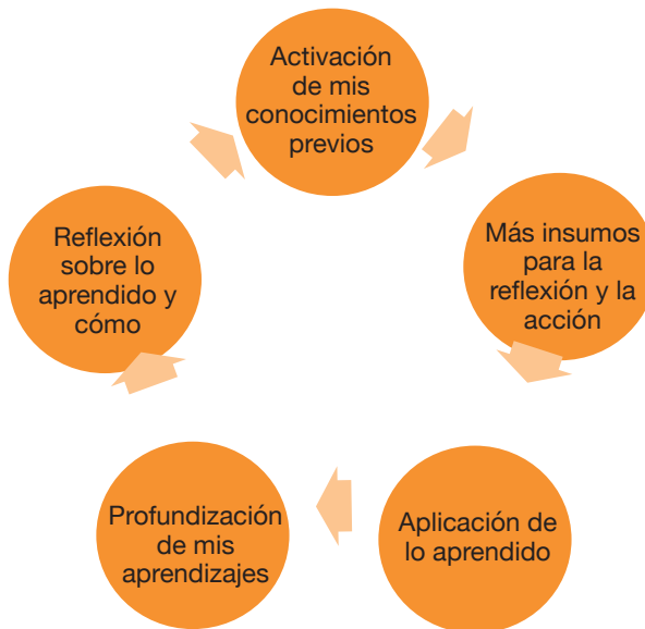
Gráfico 2. Fases metodológicas del modelo pedagógico